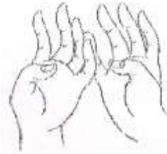
PUSHPE Flowers (white)