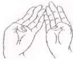
ARGHAM Nectar (white)