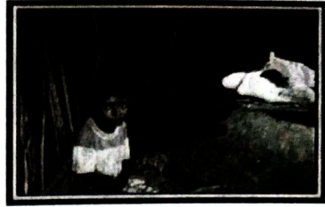
1. රූපය- විස්තෘත පවුලක්