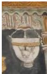
කුමාරකන්ද කුමාර මහා විහාරය