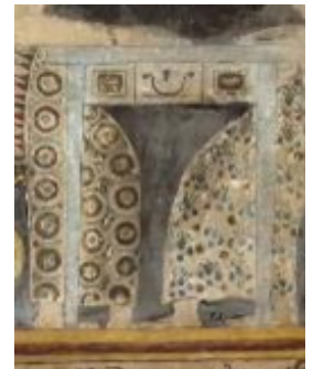
තොටගමුව රජමහා විහාරය