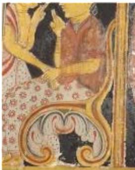
කුමාරකන්ද කුමාර මහා විහාරය