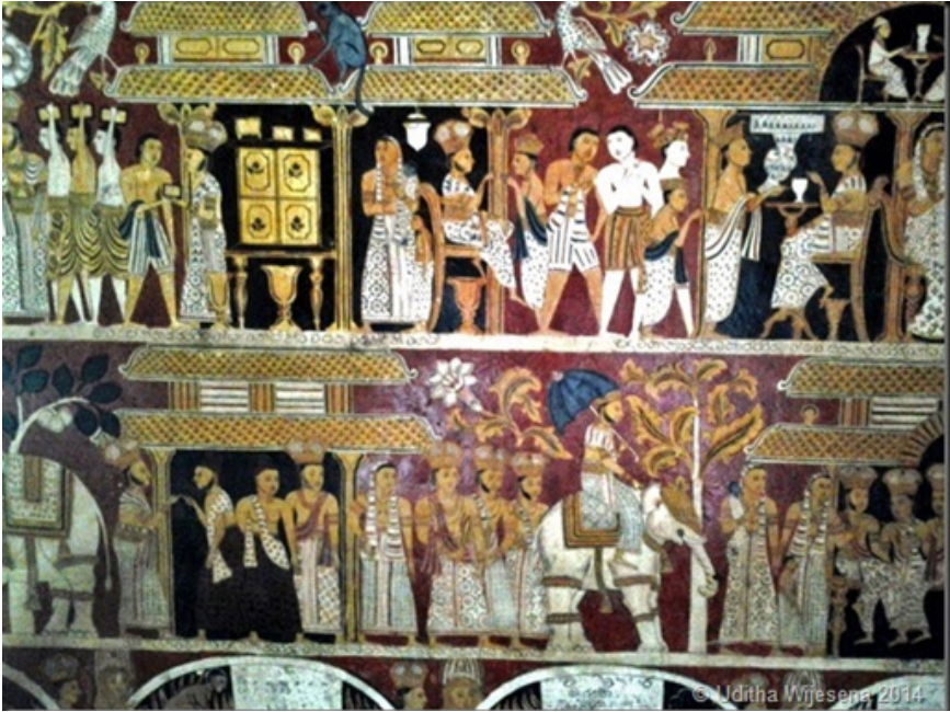
කතලව පූර්වාරාම විහාර සිතුවම්

රටා එම තිරරෙදි වල දක්වා තිබේ. මල් මෝස්තර, ජාමිතික රටා ආදී බහුලව දැකිය හැකිය. විශේෂයෙන්ම අනෙකුත් සිතුවම් වලට වාඩා පහතරට සිතුවම් තුළ ඉතා විචිත්‍ර ආකාරයෙන් රෙදි මෝස්තර යොදාගෙන ඇති බව හඳුනාගත හැකිය.