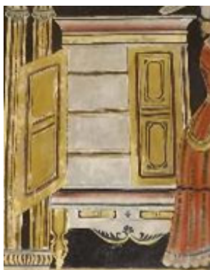
තොටගමුව රජමහා විහාරය