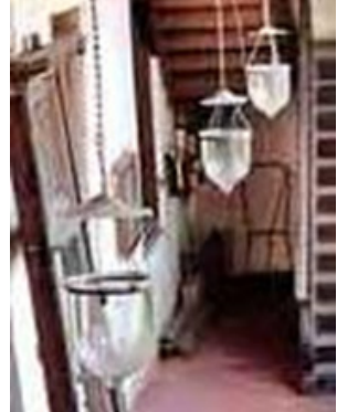
කැබිනට්, පෙට්ටගම් සහ එල්ලෙන ලාම්පු (මිලන්ද කෞතුකාගාරය)

ගෘහ උපකරණ අතීතයේ සිට පැවතගෙන ආ අංගයක් වශයෙන් හඳුන්වා දිය හැකිය. විශේෂයෙන් සාහිත්‍ය මූලාශ්‍රවල සඳහන් වන පරිදි රජමාළිගා හා ඇතැම් රාජකීය ගෘහ අංග අලංකරණයට හා ආලෝකවත් කිරීම සඳහා විවිධ වටිනා අමුද්‍රව්‍ය භාවිතයෙන් නිපැදූ ගෘහ උපකරණ සම්බන්ධයෙන් තොරතුරු බොහෝමයක් දැකගත හැකිය. දුර අතීතයට අයත් එම කරුණු සනාථ කිරීම සඳහා අවශ්‍ය ද්‍රව්‍යාත්මක සාධක දුර්වල වේ. නමුත් පහතරට යුගය නැතහොත් යටත්විජිත යුගයේ භාවිත කළ මෙවැනි ගෘහ උපකරණ පිළිබඳ තොරතුරු සාහිත්‍ය මූලාශ්‍රමය තොරතුරු වලට වඩා වැඩි පුර බිතුසිතුවම් වලින් හා ද්‍රව්‍යාත්මක වශයෙන් ද හඳුනාගත හැකි වේ. මෙම පර්යේෂණ පත්‍රිකාවේ මූලික අභිප්‍රාය වන්නේ සිතුවම් ආශ්‍රිත දක්නට ලැබෙන ගෘහ උපකරණ පිළිබඳ අධ්‍යයනයයි. විශේෂයෙන්ම මෙහි දී දේශීය හා විදේශීය ගෘහ උපකරණවල ස්වභාවය සිතුවමට ශිල්පියා යොදා ගත් ආකාරය පිළිබඳ අධ්‍යයනය සිදු කෙරේ.