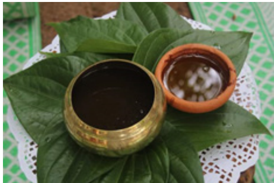
භිසතෙල් ගැමට සැකසූ තෙල් හා නානු (මූලාශ්‍රය - අන්තර්ජාලය).

නානු යන්න ක්‍රියාවක් සේ සලකන විට ස්නාන (නාන්න) යන විධානාර්ථය ද නාමයක් ලෙස සලකන කල මැලියම් යන අදහස ද ලැබෙන අතර, තෙල් යන සංස්කෘත වදන ස්නේහ යන්නෙන් තැනී ඇත. එම ස්නේහ යන්නෙන් සෙනෙහස යන්න ද අර්ථවත් වෙයි.