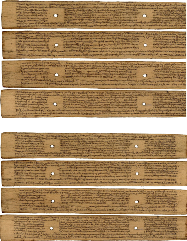
පද බෙදීම රහිත පුස්තකාල පොතකින් කොටසක්

උදාහරණයක් ලෙස පිරුවාණා පොත් වහන්සේගේ කුමන ස්ථානවලදී යතිය තැබිය යුතුද හඬ නැවැත්විය යුතුද යන්න පිළිබඳව ඔවුන්ගේ මතකයේ හොඳින් රැඳී තිබිණ. එහෙත් ඵදිනෙදා පළවන පුවත්පතක එලෙස මතකයේ තබාගත නොහැකිය. ඒ සඳහා යම්කිසි රාමුගත කළ පද බෙදීම් ක්‍රමවේදයක් භාවිතයට ගත යුතු වීම නිසා මේ සම්මතයක් ඇති කර ගැනීම සඳහා සමාජයේ විද්වත්හු උත්සුක වූහ. මේ කාරණා මූලික කරගෙන පද බෙදීම පිළිබඳව පිළිගත් සම්ප්‍රදායක් ඇති කර ගැනීම සඳහා මංපෙත් විවර වූ බව පෙන්වා දිය හැකිය.