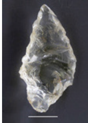
ඡායාරූප 02. බටදොඹ ලෙන් කැණීමේ 7c ස්තරයෙන් සොයාගත් බලංගොඩ උල් ආයුධයේ මතුපිට පෙනුම සහ ඇතුළේ පෙනුම. වසර 37,000 - 32,000 ට කාලනිර්ණය කර ඇත. (1980/82).