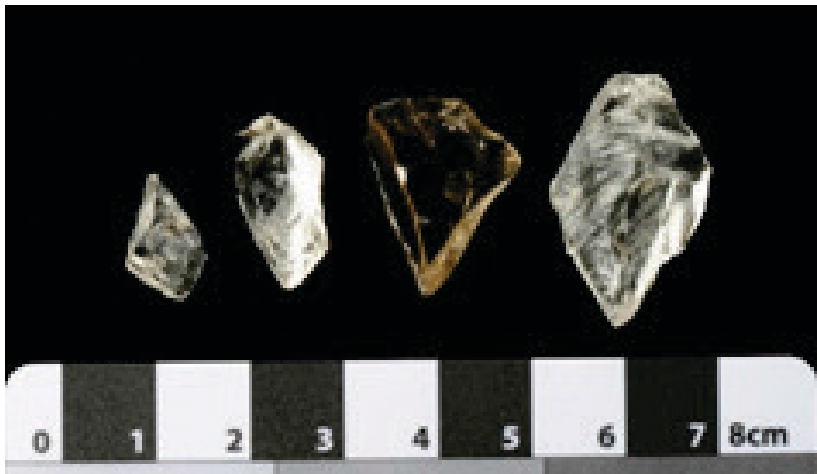
ඡායාරූප 03. පාහියන් ලෙන් කැණීමෙන් සොයාගත් ක්ෂුද්‍ර ගිලා මෙවලම්. (2009) (මූලාශ්‍රය: පුරාවිද්‍යා දෙපාර්තමේන්තුව).