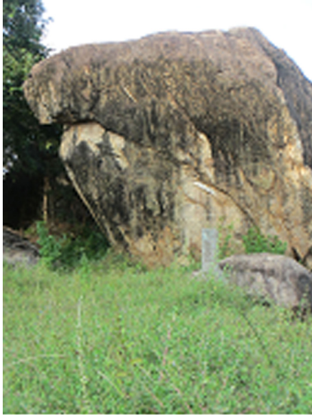
රන්මසු උයනේ ලෙන්