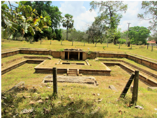
මහාවිහාරයේ ජන්රාසර පොකුණ