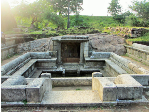
රන්මඩු උයනේ පොකුණක්