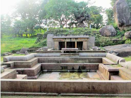
රන්මසු උයනේ පොකුණක්

වර්තමානයේ වෙස්සගිරිය ලෙසින් නාමීකරණය කර ඇති භූමියත් ඇතුළුව සමස්ත ඉසුරුමුණි විහාර සංකීර්ණය වෙත අවධානය යොමු කිරීමේ දී ඊට අයත් ප්‍රධාන විහාරාංග වන බෝධිඝරය වෙස්සගිරියේ ඊ ගල් රැන්දට බටහිර පසින් ද, උපෝසථඝරය ක ගල් රැන්දෙහි දකුණුපස කෙළවරේ ද, දානශාලාව ක ගල් රැන්දට නැගෙනහිරින් පිහිටි කුඹුරු මධ්‍යයේ ද, පැරණි ස්තූප ක ගල් රැන්ද මස්තකයේ සහ ඊට නැගෙනහිරින් පිහිටි පබ්බතාරාම කොටසේ ද, ප්‍රතිමා ගෘහ කිහිපයක් ද ඇතුළු ව හික්ෂු ආවාස හඳුනාගත හැකි අතර අනෙකුත් ආරාම සංකීර්ණයන්හි දක්නට ඇති අලංකාර පොකුණු මෙම විහාර සංකීර්ණයේ උතුරු කෙළවරෙහි ඇති රන්මසු උයනට ගොනුකර ඇති බව මෙම පර්යේෂණයෙන් තහවුරු කරගත හැකි විය. ඒ අනුව සමස්ත ආරාම භූමියෙහි ප්‍රයෝජනය පිණිස අලංකාර ලෙස සකස් නොකළ පොකුණු කිහිපයක් ම වගුරු සහ පතන වශයෙන් දැනට දකගත හැකි අතර අලංකාර ලෙස සකස්කළ පොකුණු පිහිටුවා ඇත්තේ පහසුවෙන් ම ජලය සම්පාදනය කළ හැකි රන්මසු උයන භූමියෙහි ය. සිව්වැනි මිහිදු රජුගේ සෙල්ලිපියෙහි සඳහන් පරිද්දෙන් ම රන්මසු උයන ප්‍රමුඛ කොටගත් ඉසුරුමුණි විහාරයට අයත් පොකුණු වෙත ජලය සම්පාදනය කිරීම තිසාවැවේ මොහොල්නග සොරොව්ව භාර නිලධාරියාගේ ප්‍රධානතම කර්තව්‍ය වන්නට ඇති බවට නිගමනය කළ හැකි හෙයින් මෙය හුදෙක් රාජකීය මගුල් උයන නොව ඉසුරුමුණි විහාරවාසී භික්ෂූන්ගේ ප්‍රයෝජනය පිණිස නිර්මාණය කළ පොකුණු පද්ධතියක් බව තහවුරු කළ හැකි වේ.