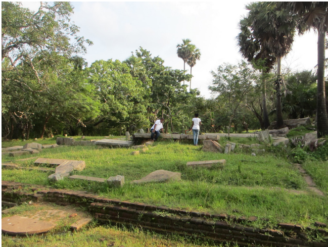
පධානසර සම්ප්‍රදායේ ගොඩනැගිල්ල