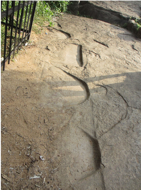
වක්‍රය ඉදිරිපිට ඇති ආසන